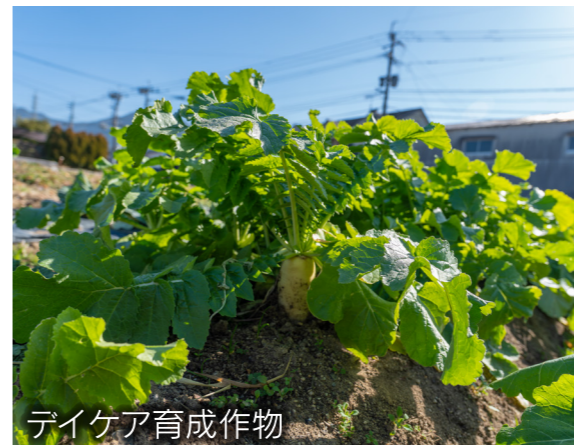
テイケア育成作物