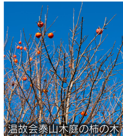
温故会泰山木庭の柿の木