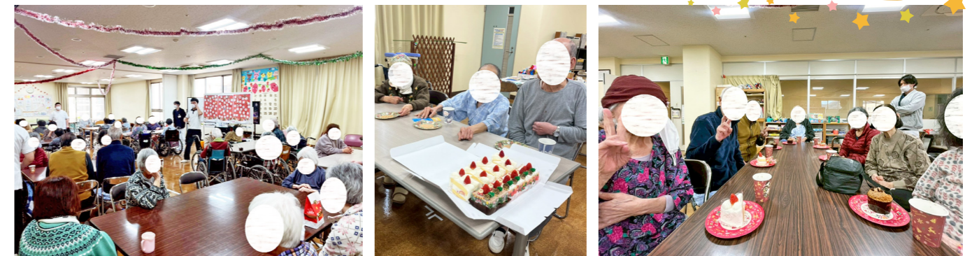
満面の笑みで写真もとりました！ テンション上がりますよね！

3病棟では「プレゼントシュート」と題して、机に人形を並べ、そこにボールを転がし当てるゲームです！