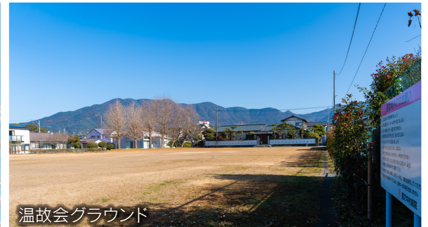
温故会グラウンド